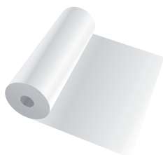
Rollo de papel.