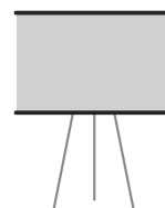
Pizarra o papelógrafo.